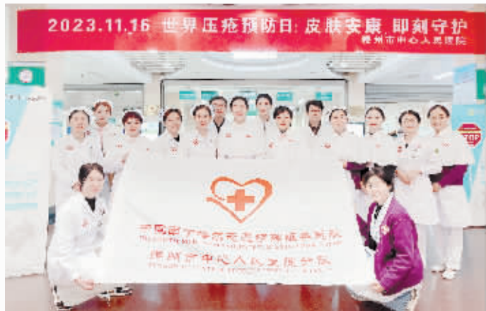
给家庭造成极大的负担。本次义诊活动，提升了广大群众对压疮的认知及预防重视程度，让更多人关注

压疮，俗称“褥疮”，是一个全球性的健康问题，是长期坐轮椅、卧床等行动不便者和老年常见的并发症，严重影响着人们的健康，