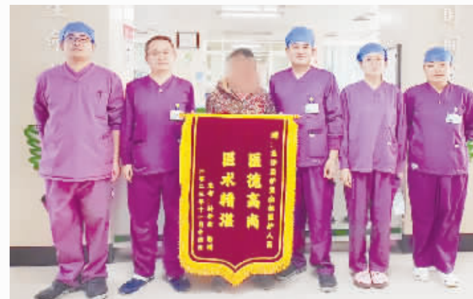
EICU 送上一面锦旗。孙阿姨激动地说：“人民医院在我最困难的时候救了我一命，感谢所有的医生、护士待

住院期间，EICU 医务人员与孙阿姨建立了良好的医患关系，科室全权负责孙阿姨的生活护理，大家吃什么，孙阿姨就吃什么。11月14日，孙阿姨来院补缴住院费用，并为