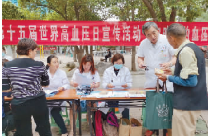
高了患者对高血压的认识。通过本次高血压的义诊和患者宣传活动,加强了百姓对个人血压

本报讯 5月17日是我国第15个世界高血压日。高血压是种世界性的常见病、多发病,严重威胁着人类健康。高血压患者的知晓率、治疗率及控制率不高。为引起人们对防治高血压的重视,提高高血压的公众认知,5月17日上午,我院心内科十余名医护人员在朱宗涛主任带领下,结合高血压日活动主题“知晓你的血压”,在人员密集的三角花园开展免费义诊活动,免费血压筛查,对患者进行健康宣传、发放高血压防治手册,宣传材料,并教患者如何测量及记录血压。