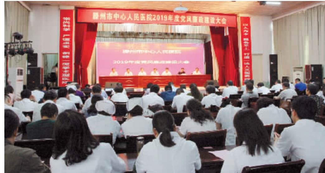
委市政府的坚强领导下,深入贯彻落实习近平新时代中国特色社会主义思想

本报讯 为深入学习贯彻习近平新时代中国特色社会主义思想,全面落实党的十九大和十九届二中、三中全会精神,认真贯彻十九届中央纪委三次全会、省纪委十一届四次全会、枣庄市纪委十一届四次全会和滕州市纪委十三届五次全会部署,强化广大医务工作者廉洁行医意识,提高拒腐防变能力,5月17日,我院召开2019年度党风廉政建设工作会议。医院领导班子成员、全院中层干部参加了会议。会议由院长杨琼主持。