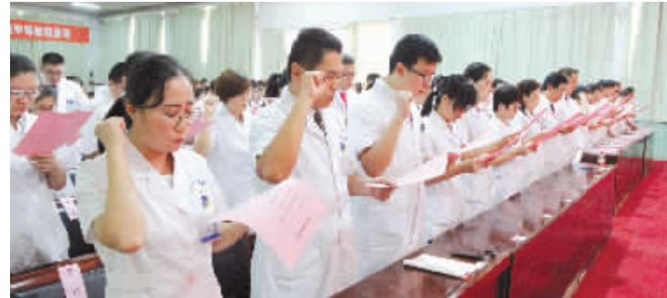
庆祝首届中国医师节

二〇一八年，我们坚持医院文化自信，打造优质服务品牌。 全力营造特色医院文化，将开放、包容、创新、敬业的文化内涵，内化于心，外化于行。通过举办丰富多彩、寓教于乐、健康向上的党群和文体活动，着力提高全院职工文明修养和道德素质。积极开展“首届医师节”和“护士节”纪念活动，弘扬高尚的职业精神。加强职工医德医风教育引导，把优质服务纳入考核范畴。积极改善职工福利保健待遇，建立全院职工互济互助、扶危济困的长效机制。宣传工作成为重要的“生产力”，通过着力打造“一网一报一微一端”的全媒体矩阵，跻身中国医院品牌传播创新十强。深入推动改善医疗服务，精心组织开展善国名医、十佳护士、优秀青年医师、青年文明号等创建活动，不断丰富优质服务载体，让先进的文化理念引领医院一路前行。