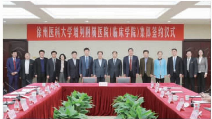
成功签约徐州医科大学附属医院

根据医院“十三五”发展战略部署，积极寻求国内、国际合作，加强院内外学术深度融合，正式成为“徐州医科大学附属医院”，为我院提供了新的机遇和平台。