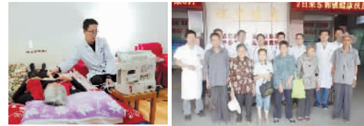
选派业务骨干进行医疗援疆

二〇一八年，我们坚持深化公立医院改革，发展成果服务于民。 通过控制药占比、耗材比，合理检查、合理用药，缩短平均住院日，提高病床周转率等手段，不断加强对门诊、住院费用的管控，切实减轻群众就医负担。积极构建更加精细化、规范化、科学化绩效分配体系，员工福利待遇与事业发展同步提升，干事创业的积极性进一步激发；加大健康扶贫攻坚力度，加强健康教育与健康促进工作，积极开展健康知识普及、健康生活方式推广等专项行动，同步完善全市慢病防治体系。着力搭建滕州市分级诊疗平台信息共享平台，进一步畅通双向转诊渠道。先后选派33名医务人员分别到泗水、山亭等基层医院参加对口支援、卫生支农、西部隆起带重点区域基层服务等帮扶工作，选派1名业务骨干进行医疗援疆。