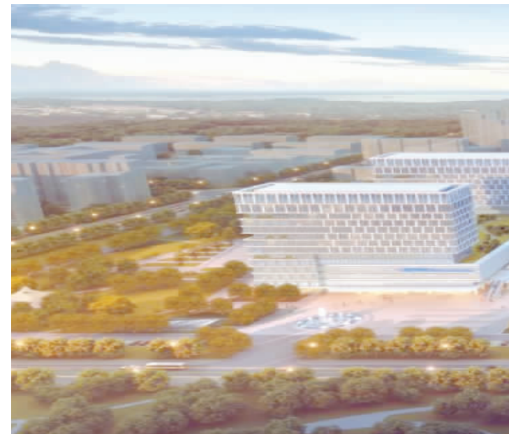
全面启动新院区规划建设

二〇一八年，我们坚持硬件建设不动摇，推进医院跨越发展。 在巩固主院区发展的基础上，坚持高点规划、科学定位、互补发展的原则，全面启动新院区规划建设工作。全力将新老两院打造成集医疗、急救、科研、教学、保健、康复为一体，功能齐全、专业互补、服务便捷、设施一流的现代化人文医院；不断加快信息化建设进程，历经10个月的努力，顺利通过国家医疗健康信息互