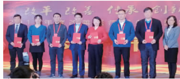
荣获全国“改善医疗服务优秀医院”称号

二〇一八年，我们坚持医院文化自信，打造优质服务品牌。 全力营造特色医院文化，将开放、包容、创新、敬业的文化内涵，内化于心，外化于行。通过举办丰富多彩、寓教于乐、健康向上的党群和文体活动，着力提高全院职工文明修养和道德素质。积极开展“首届医师节”和“护士节”纪念活动，弘扬高尚的职业精神。加强职工医德医风教育引导，把优质服务纳入考核范畴。积极改善职工福利保健待遇，建立全院职工互济互助、扶危济困的长效机制。宣传工作成为重要的“生产力”，通过着力打造“一网一报一微一端”的全媒体矩阵，跻身中国医院品牌传播创新十强。深入推动改善医疗服务，精心组织开展善国名医、十佳护士、优秀青年医师、青年文明号等创建活动，不断丰富优质服务载体，让先进的文化理念引领医院一路前行。