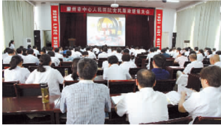
党的建设引领医院各项事业全面发展

二〇一八年，我们坚持以十九大精神为指引，全面加强党的领导。 按照新时代党建要求，医院把党建工作摆在首要位置，始终在思想上、行动上、政治上与党中央保持高度一致。坚决维护以习近平同志为核心的党中央权威和集中统一领导，把“四个意识”落实在岗位和行动上，切实改进作风，让党建引领医院各项事业全面发展。大力弘扬正气，大力推进反腐倡廉，不断创新党员干部教育、管理、监督和服务途径，提升党员干部队伍素质。全年完成23个党支部的调整设置，着力将党支部与学科建设互补发展，实现了党建工作与学科建设等中心工作的深度融合，为全面强化中青年人才价值引领，提供了坚实的政治保障。