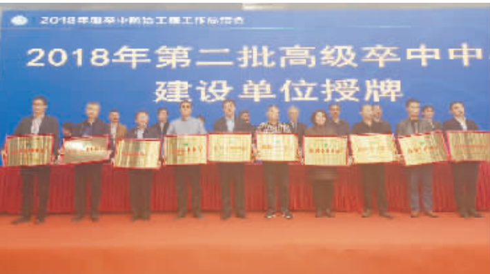
荣获国家高级卒中中心建设单位称号

医院“卒中中心”成功进入国家队，经国家卫生健康委卒中防治工程委员会综合和评价考核，正式授予我院国家级“高级卒中中心”建设单位称号，标志着医院在“脑卒中”规范化诊疗方面走在国内前列。