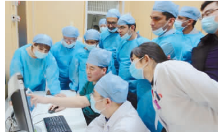
广泛开展国内外国际学术交流

人才引进与聚智计划全面提速。大力实施“中青年医学人才培养计划”，一大批优秀青年医生前往美国、欧洲等国际顶尖医院进修学习；广泛开展国内、国际学术交流活动；积极争取有关部门在职称聘任给予支持，全年完成高级职称晋升120人、新引进硕博研究生人才25人。有多人荣获“山东省优秀护士长”“枣庄市突出贡献中青年专家”“滕州英才”等荣誉称号。