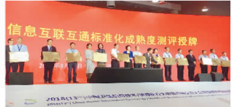
通过国家信息互联互通“四级甲等”医院测评

联互通标准化成熟度“四级甲等”医院测评；继续加大高端医疗设备的投入力度，购置了高端超声，高清胃肠镜、腹腔镜，高端螺旋CT，大孔径CT等先进医疗设备，大大提高了医院的诊疗水平。