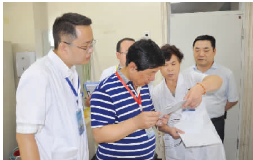
专家现场检查指导工作

本报讯 为响应国家医改“强基层”的政策号召,加强医院管理,提升服务水平,全面提升质量管理水平,8月9日至11日,国家卫计委医院管理研究所张洪杰教授、陈正英教授、王燕教授、朱珠教授、李国宏教授、杨芸教授一行6人来院进行“医院质量管理持续改进项目”培训与指导。全体院领导、行管职能科室负责人、临床医技科室主任、护士长及科室质控员参加了培训。