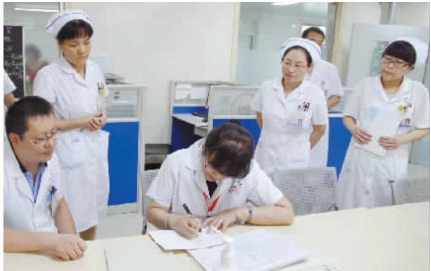
专家现场评价检查