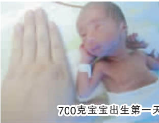
700克宝宝出生第一天

用的新生儿进口呼吸机、进口及国产暖箱、开放式抢救台、心电图监护仪、血气分析仪等先进设备以及各种心电、血氧和血压、出入量的监护,有创或无创的呼吸支持,肠内外营养支持等先进技术。保障了危重症早产儿的抢救成功率,改善了其远期预后。